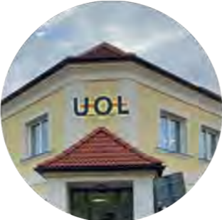
Praha – centrála