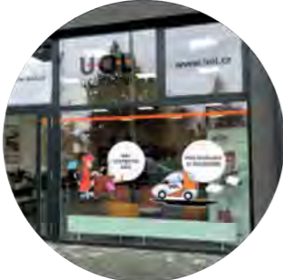
Ústí nad Labem